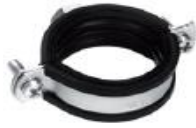
Хомут с вкладышем EPDM